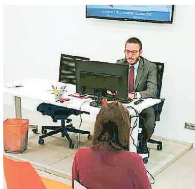
Una delle sale di Astalegale.net

Astalegale.net gestisce nei nuovi uffici di via Berchet le vendite giudiziarie telematiche e fornisce le informazioni. BELLOTTO / APAG. 15