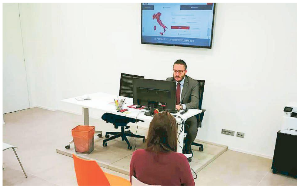
L'interno di una delle sale di Astalegale.net negli uffici di via Berchet a due passi dal tribunale